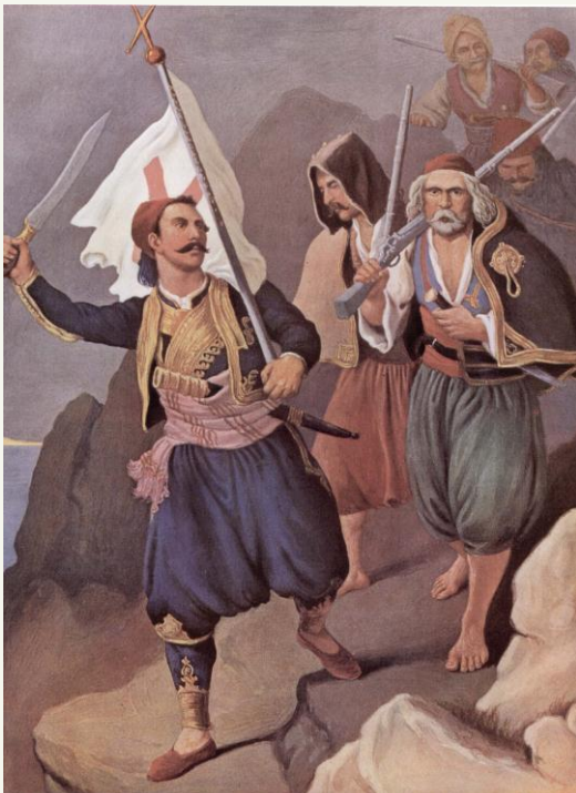
Εικόνα 2: Ο Πετρόμπεης Μαυρομιχάλης επαναστατεί τη Μεσσηνία. Παρίσι, Εθνική Βιβλιοθήκη (1821, Η Ελληνική Επανάσταση. Peter Von Hess, 40 Έγχρωμες Λιθογραφίες με Ήρωες και Μάχες του Αγώνα, εκδ. Δέλτα, Αθήνα 1996, σ. 43).

Η ματαίωση του σχεδίου αυτού, αντί να απογοητεύσει τους Μανιάτες, μάλλον ενέτεινε το επαναστατικό τους φρόνημα. Ήδη από τις αρχές του 1821 επικρατούσε πολεμικός αναβρασμός στην περιοχή, όπως και στην υπόλοιπη Πελοπόννησο. Ακολουθώντας τις εντολές της Φιλικής Εταιρείας, είχαν έλθει στη Μάνη ο Παπαφλέσσας και σπουδαίοι οπλαρχηγοί, όπως ο Αναγνωσταράς και ο Θεόδωρος Κολοκοτρώνης, οι οποίοι περιφέρονταν στα χωριά και στρατολογούσαν τους κατοίκους. Οι προετοιμασίες διεξάγονταν εντελώς απροκάλυπτα στην Ανατολική Μάνη, όπου η παρουσία της εξουσίας ήταν, ουσιαστικά, ανύπαρκτη, και πιο ήπια στη Δυτική, όπου βρισκόταν η έδρα του μπέη. Ο Πετρόμπεης είχε με επιτυχία κατορθώσει να καλύψει την παρουσία και τη δράση των οπλαρχηγών, αλλά και να αποφύγει τη μετάβασή του στην Τρίπολη, στα τέλη Φεβρουαρίου, όταν ο Τούρκος διοικητής της Πελοποννήσου, προκειμένου να αποδυναμώσει το ενδεχόμενο της εξέγερσης στην επικράτειά του, κάλεσε όλους τους αρχιερείς και τους προκρίτους της Πελοποννήσου, με το πρόσχημα της σύσκεψης, στην πραγματικότητα, όμως, για να τους κρατήσει εκεί. Προφασιζόμενος ασθένεια, ο