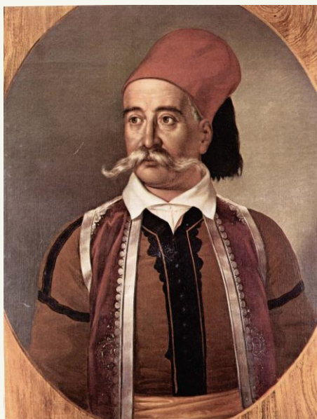
Εικόνα 3: Προσωπογραφία του Πετρόμπεη Μαυρομιχάλη. Αθήνα, Εθνικό Ιστορικό Μουσείο (Ιστορία του Ελληνικού Έθνους, Εκδοτική Αθηνών, Αθήνα, τ. ΙΒ', σ. 92).

επιστολών διακόπηκαν εντελώς. Οι αρχηγοί είχαν πια αφοσιωθεί αποκλειστικά στην προετοιμασία των δυνάμεών τους.