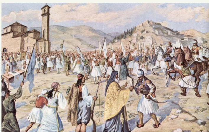
Εικόνα 4: Αναπαράσταση της δοξολογίας της 23ης Μαρτίου 1821 στην Καλαμάτα. Καλαμάτα, Μπενάκειο Μουσείο (Ιστορία του Ελληνικού Έθνους, Εκδοτική Αθηνών, Αθήνα, τ. ΙΒ', σ. 88).